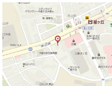
ジャパンレンタカー星ヶ丘店前 集合