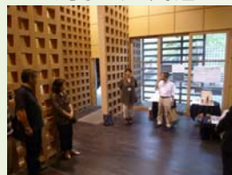
「森林文化アカデミー&平野木材（各務原市、木材工業団地）&美濃市うだつの上がる町並み」（2011.9.3）