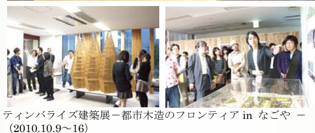
ティンパライズ建築展—都市木造のフロンティア in なごや— (2010.10.9~16)