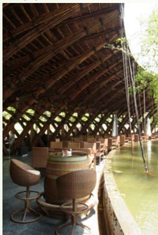
ベトナムの竹建築 —Flying Bamboo(ハノイ) (2012.8)