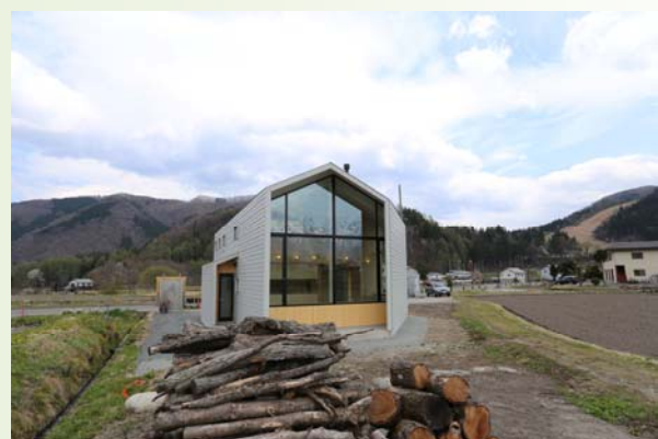
「Hakuba house 竣工見学会+長野県木造現代建築ツアー」 (2013.5.25~26)